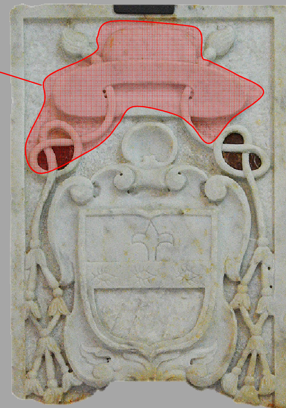
Bottega meridionale, secc. XVIII-XIX Marmo scolpito, intarsiato https://www.museooppidopalmi.it/oper e/i-manufatti-lapidei/132-stemma-vescovile

Osservando lo stemma vescovile dei Medici nella pagina precedente a destra ed il marmo riportato qui, sempre a destra, è immediato riconoscere nel frammento bibbonese la parte superiore di un tipico stemma vescovile con le due cordicelle uscenti dalla apertura del cappello prelatizio (detto galero) usato anche, con la colorazione verde, per gli stemmi vescovili.